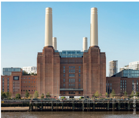
Battersea Power Station, London