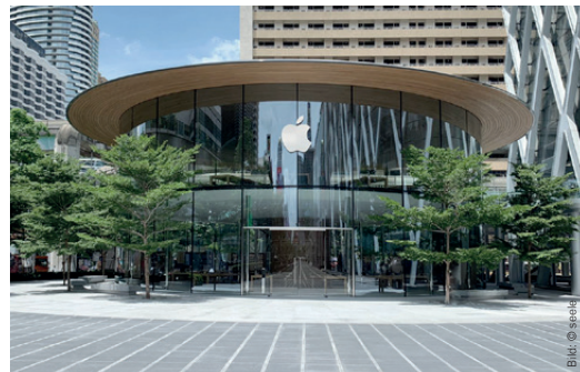
Apple Central World, Bangkok