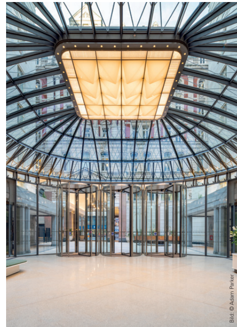
80 Strand, London