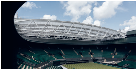
No.1 Court Wimbledon Roof, London