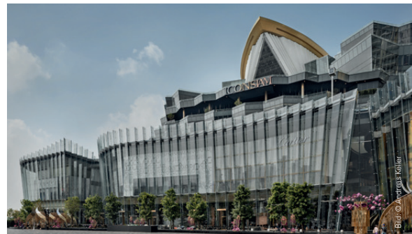
ICONSIAM Shopping Centre, Bangkok