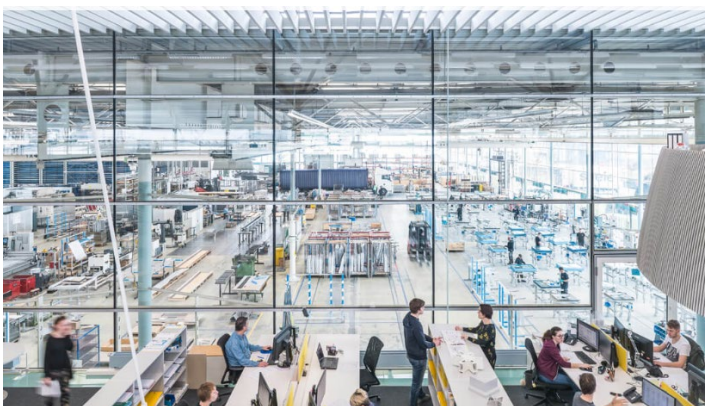
Konstruktions- und Fertigungsabläufe verschmelzen immer weiter. Die gläserne Fertigung schuf seele bereits 1990.