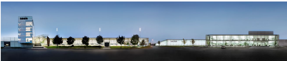
Die Firmengebäude der seele GmbH und der sedak GmbH & Co KG.