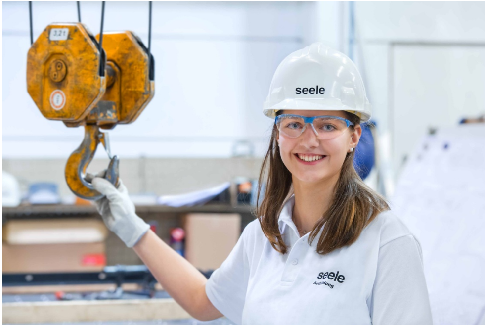
Ausbildung zum Metallbauer Konstruktionstechnik w/m bei seele in Gersthofen