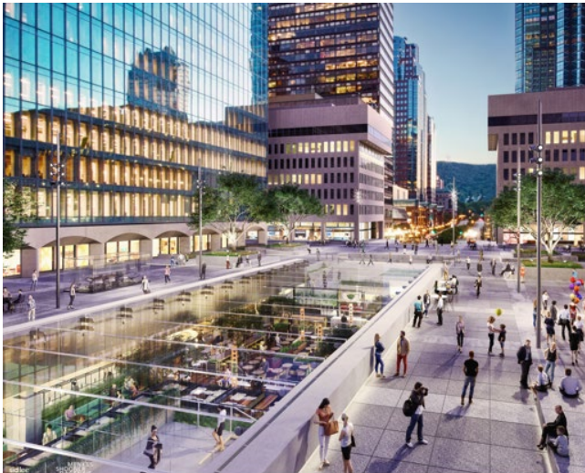
Rendering zum Glasdach Grand Hall am Place Ville Marie in Montreal