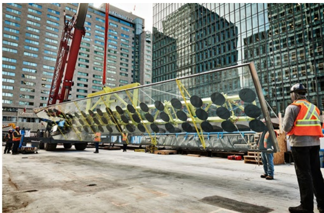
Einsatz der Glasvakuummaschine zur Montage einer 15 x 2,5m großen Isolierglas-scheibe