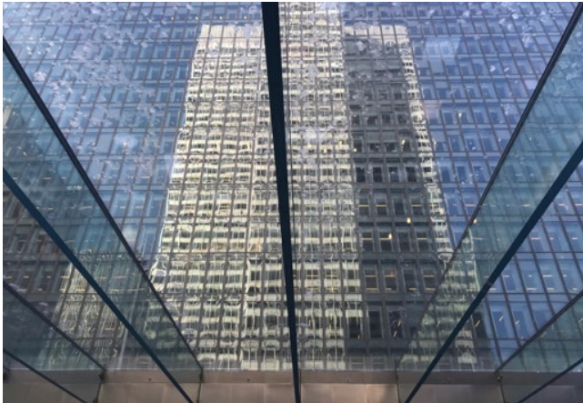
Blick von der Food & Shopping Mall nach außen auf den Place Ville Marie